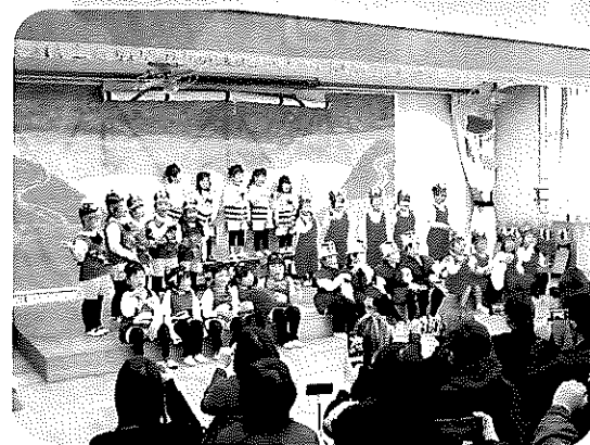
<さるかにがっせん>