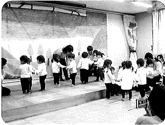
<どうぶつたちのおんがくかい>