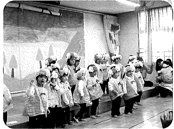
<えがおあふれる りすくみさん>

○いつも本当にありがとうございます。いつも「ハイチーズ」でたくさんの写真、コメントではその日のエピソードや先生の思いなども長文で載せてくださり、ありがとうございます。園での様子がよくわかり文章から先生の愛も伝わり、仕事にみてもほっこりする毎日です。本当に子どもたちのことをよく見てくださっていて、感謝、感謝です。