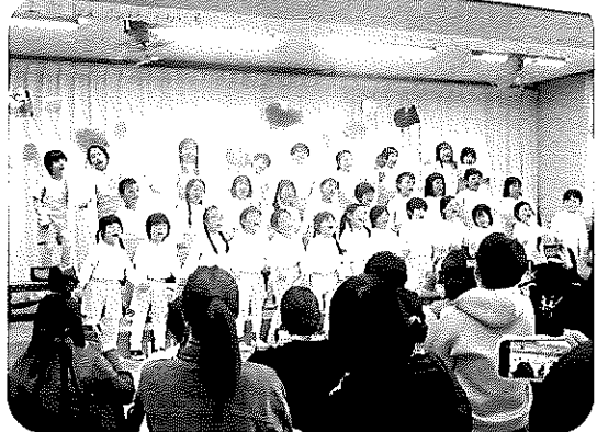
<スイミー・世界に一つだけの花>