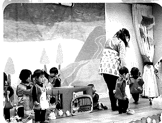
〈みんななかよし ひよこくみ〉